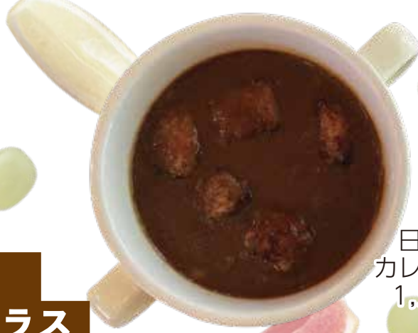
日替わり カレーライス 1,200円