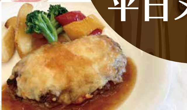
チーズハンバーグ 1,500円