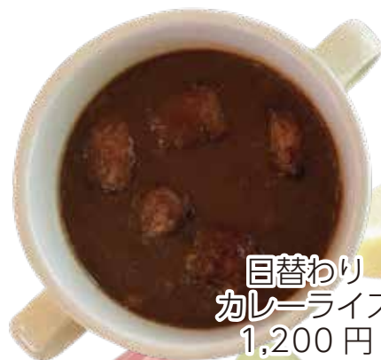
目替わり カレーライス 1,200円